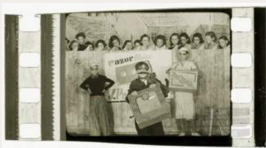
Figura 11 - Fotograma do filme realizado em Terezín como propaganda nazista (1944-1945)

Lembremos brevemente que a ópera narra a trama dos irmãos Aninka e Pepicek, ocupados em tentar ganhar dinheiro para comprar leite à mãe enferma. Por adotarem a cantoria como método para arrecadar a quantia necessária, atraem a má atenção do realejo Brundibár, que toca seu órgão com o mesmo objetivo e não aprecia a concorrência, aumentando, então, o volume de seu som para suprimir as vozes das duas crianças. Em tradução literal, a palavra “ Brundibár ” significa “zangão”. O zumbido metálico produzido pelo músico faz uma clara alusão à sonoridade do inseto, mas também ao pesado maquinário bélico alemão utilizado na época. Temos, ainda, outra figura de linguagem ainda mais significativa: como observável nos registros das performances (como o fotograma abaixo), além de em relatos verbais de crianças sobreviventes, fazia parte do figurino do personagem Brundibár um grande e caricato bigode. Esse traço físico é uma referência confirmada ao icônico bigode de Adolf Hitler, associando-o frontalmente à figura do vilão da história da peça.