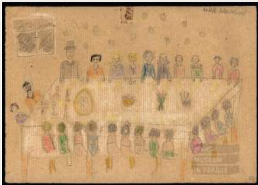
Figura 1 - Desenho de Anna Klausnerová: Sederová večěře

O desenho de Anna Klausnerová (Figura 1), intitulado Sederová večěře (“Jantar Sêder”, tradução nossa.), representa o Sêder: o jantar cerimonial da Páscoa judaica. A autora do desenho, ao figurar a cerimônia com os elementos característicos da cultura hebraica, reafirma os valores e tradições de seu povo ao mesmo tempo em que desliza para fora de Terezín por meio de suas memórias.