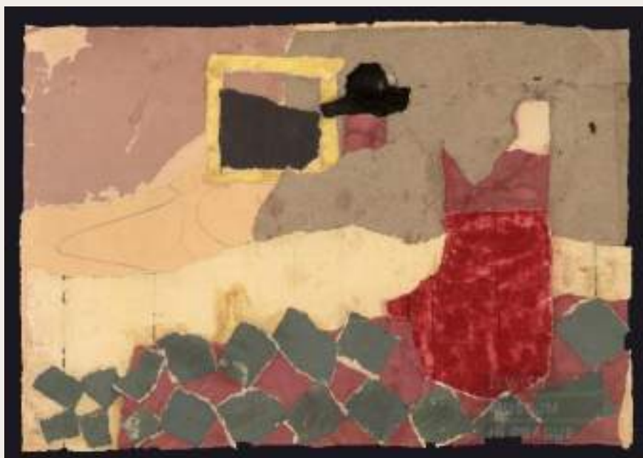
Figura 4 - Anna Brichtová: Colagem baseada em um modelo (Jan Vermeer van Delft)

Johannes Vermeer, O copo de vinho, 1658-1660, 67,7 cm x 79,6 cm, pintura à óleo. Museu estatal de Berlim, Gemäldegalerie.