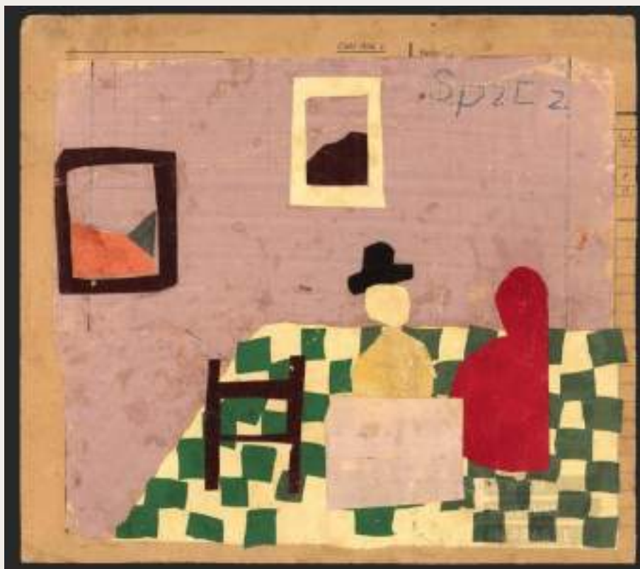
Figura 5 - Anita Spitzová: Jan Vermeer van Delft (Colagem baseada em um modelo)

Anita Spitzová, Koláž podle předlohy (Jan Vermeer van Delft) , 1943-1944, 24,8 cm x 27,8 cm, colagem em papel.