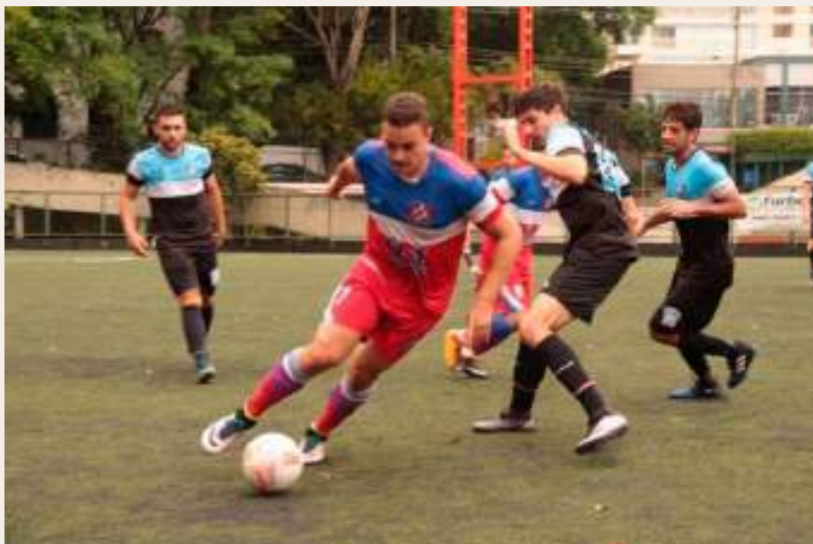
Na final do Paulista Universitário FUPE, no jogo entre Engenharia Mackenzie e Comunicação Mackenzie.