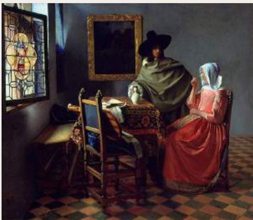
Figura 3 - Johannes Vermeer: O copo de vinho

que abstraem o realismo acadêmico presente no quadro original apresentam como resultado a visão particular de cada criança por ocasião do contato com a pintura em questão.