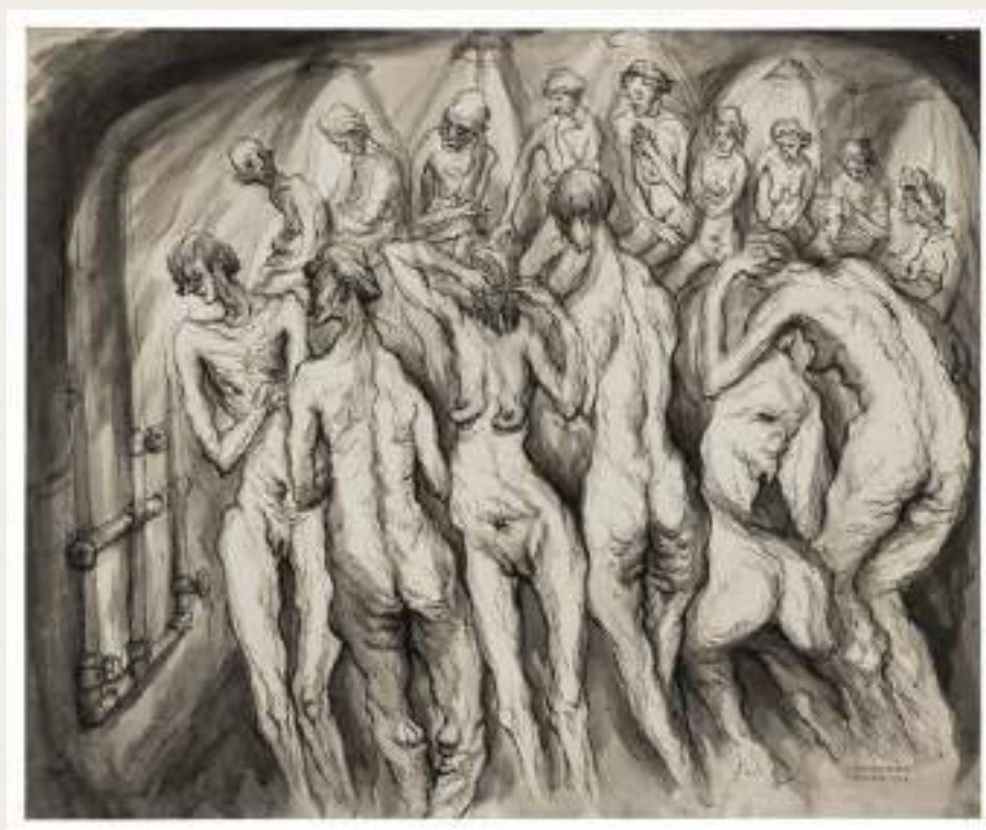
Figura 9 - Karel Fleishmann, Showers in Terezín, 1943.

Figura 9 - Karel Fleishmann: Chuveiros em Terezín