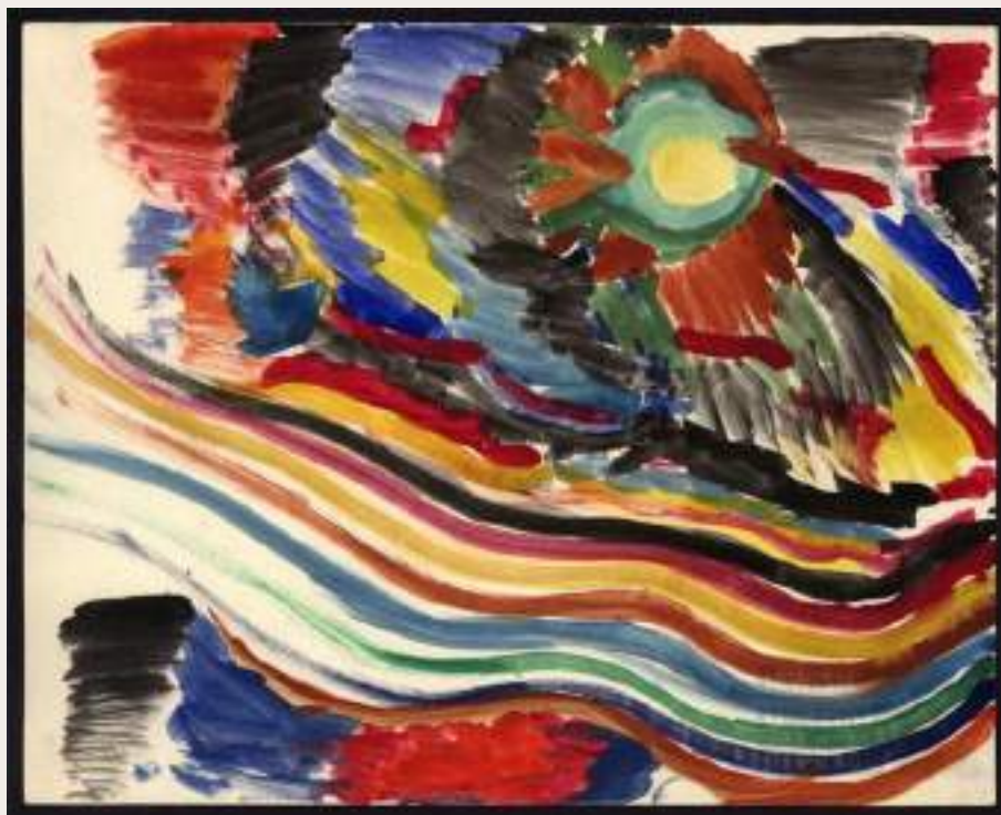
Figura 2 - Composição de cor abstrata

Autor desconhecido, Abstraktní barevná kompozice , 1943-1944, 19,8 cm x 24,9 cm, aquarela sobre papel.