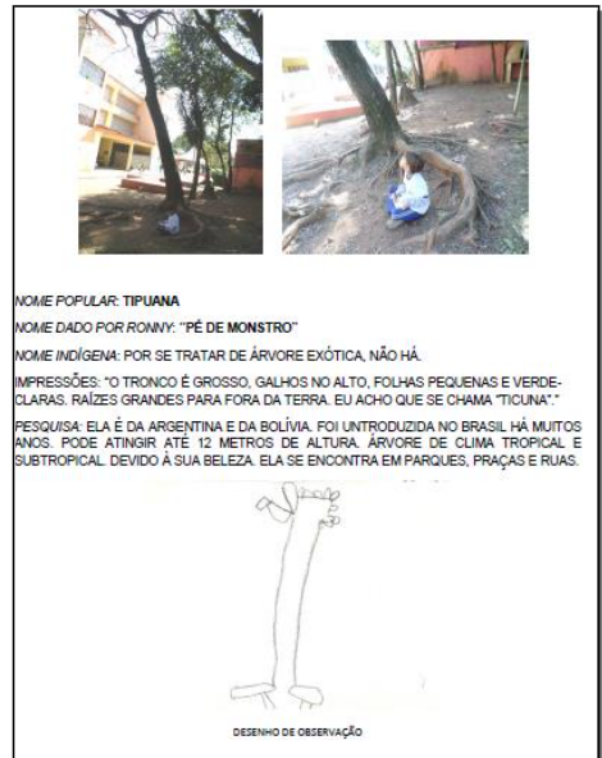
Figura 3 – Páginas do livro Árvores e Plantas do Amorim .

No desenvolvimento do projeto, os nomes das árvores foram se revelando e as mudanças temporais que ocorriam nas folhas, flores e frutos foram acompanhadas. Nos horários de parque e recreio sempre havia um estudante compartilhando as transformações observadas.