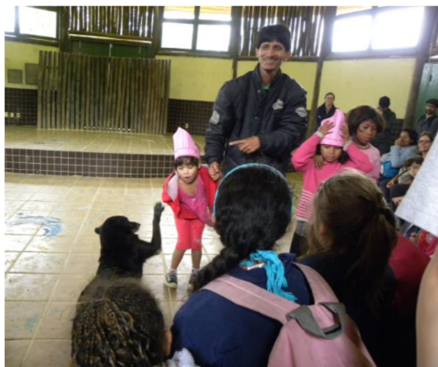
Figura 7 – Estudo de Campo: Visita à Aldeia Guarani Krukutu.