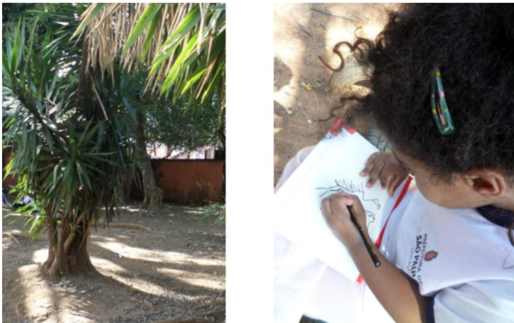
Figura 2 – Criança observando e desenhando no parque.

Como no mito da samaumeira, as relações intrínsecas dos povos indígenas com seu meio constituem as cosmologias (ou epistemologias) dos povos originários. Criando uma analogia com a ocupação feita pelas crianças no parque da escola, espaço cotidianamente ocupado por elas e, portanto, que constitui o que elas são e sabem, o espaço é sujeito e não objeto na troca de saberes com as crianças, por isso, foi escolhido como espaço de pesquisa.