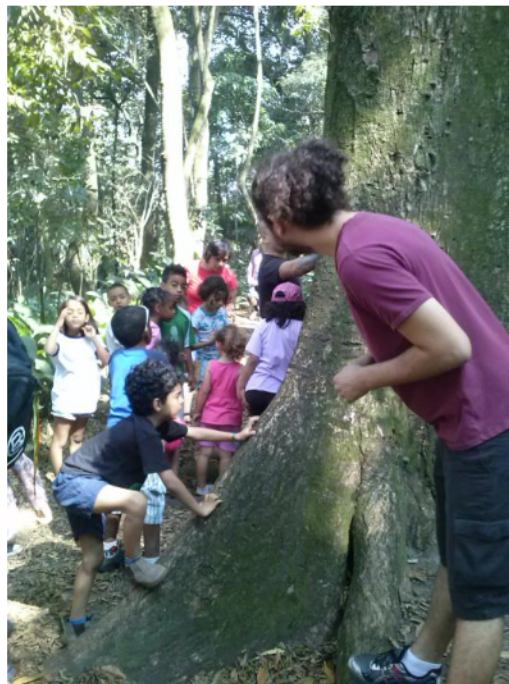
Figura 6 – Estudo de Campo: Visita ao Parque da Previdência, trilha do jequitibá.

Ainda no contexto desse projeto, foram realizados alguns estudos de meio, tais como: uma caminhada monitorada pela “Trilha do Jequitibá”, no Parque da Previdência e uma visita à aldeia Guarani Krukutu, ambos na cidade de São Paulo.