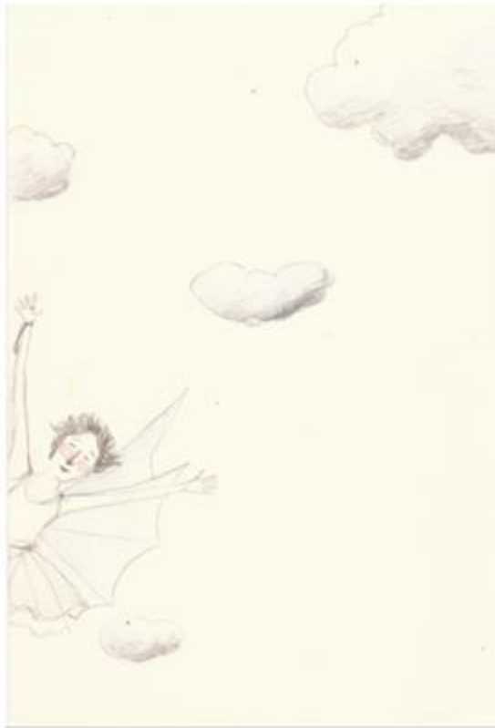
Figura 14: Desenho em lápis pastel de Natalia Regina Gregorini.

A produção realizada durante a disciplina possibilitou a concretização de uma exposição de artes que foi intitulada Arte & Estágio: Vivências e Percursos Poéticos (fig. 15). Realizada no 1º piso da Biblioteca Central Cesar Lattes – BCCL da Unicamp de 16 a 30/11/2015 contou com o apoio da Biblioteca e da Galeria do Instituto de Artes da Unicamp - GAIA. Como a Biblioteca Central Cesar Lattes é um dos espaços culturais mais importantes da Universidade, a apropriação e instalação da exposição nesse espaço ampliou o reconhecimento e a valorização dos objetos artísticos desses jovens no ambiente acadêmico. Além disso, através de sua concretização, essa exposição permitiu que as trajetórias pessoais e coletivas fossem revisitadas esteticamente por seus autores rememorando a experiência de estágio e compartilhando essa vivência com outros públicos.