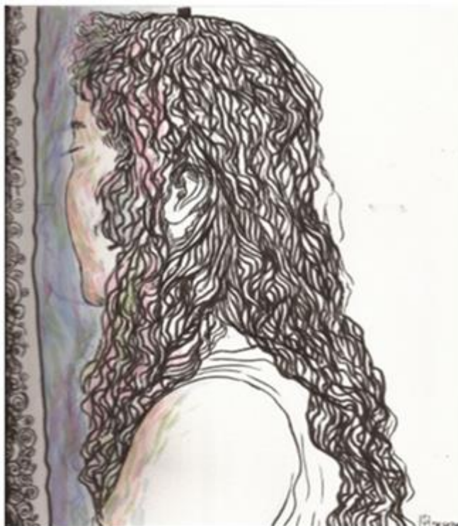
Figura 08: Desenho e pintura a nanquim de Fernanda Costa Gaspar.

O trabalho intimista de Fernanda Costa Gaspar (fig. 08) expressa delicadamente a figura feminina ressaltando a textura do cabelo por meio do requinte linear: