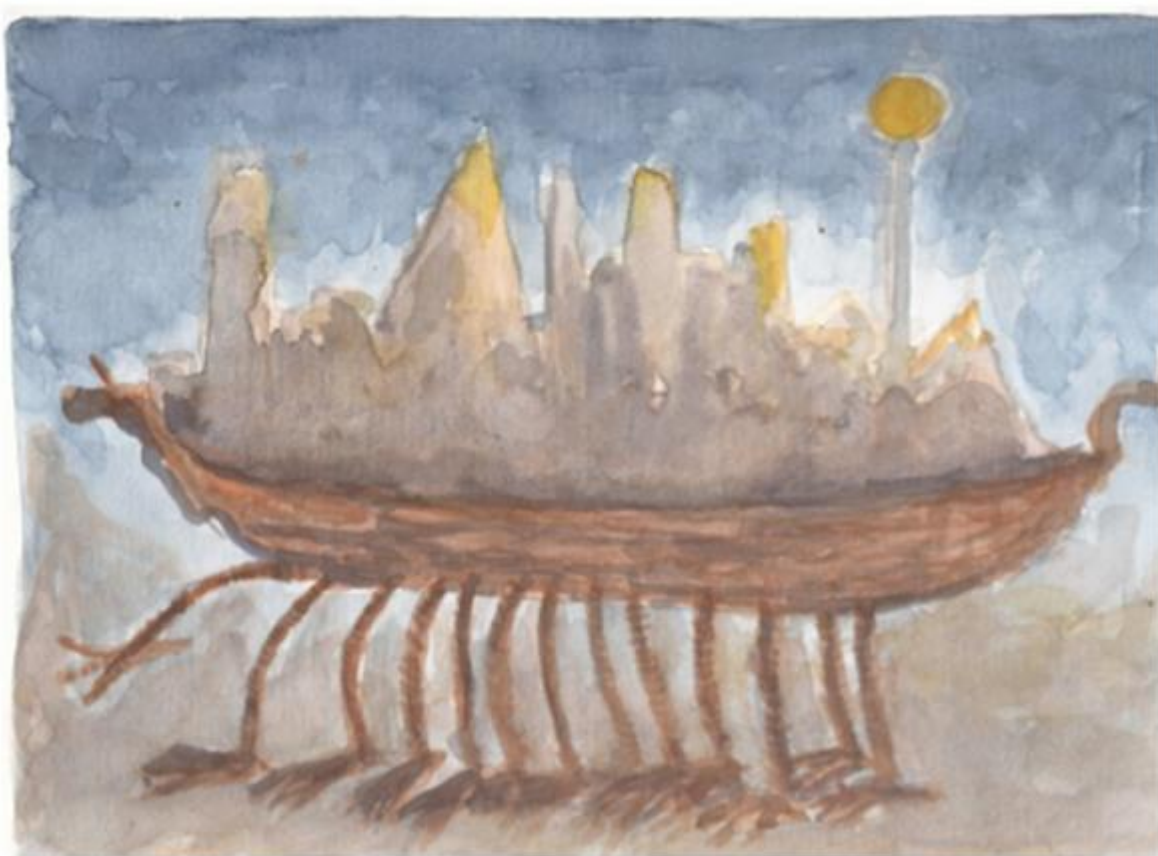
Figura 07: Aquarela de Guilherme Strafacci Orosco.

Os trabalhos que os estudantes traziam refletiam momentos pontuais de seus processos vivenciais, porém é possível observar que as imagens representadas transcendiam estes objetivos primordiais. Neste trabalho (fig. 07) Guilherme Strafacci Orosco explora o imaginário, o movimento da figura e a transparência da aquarela: