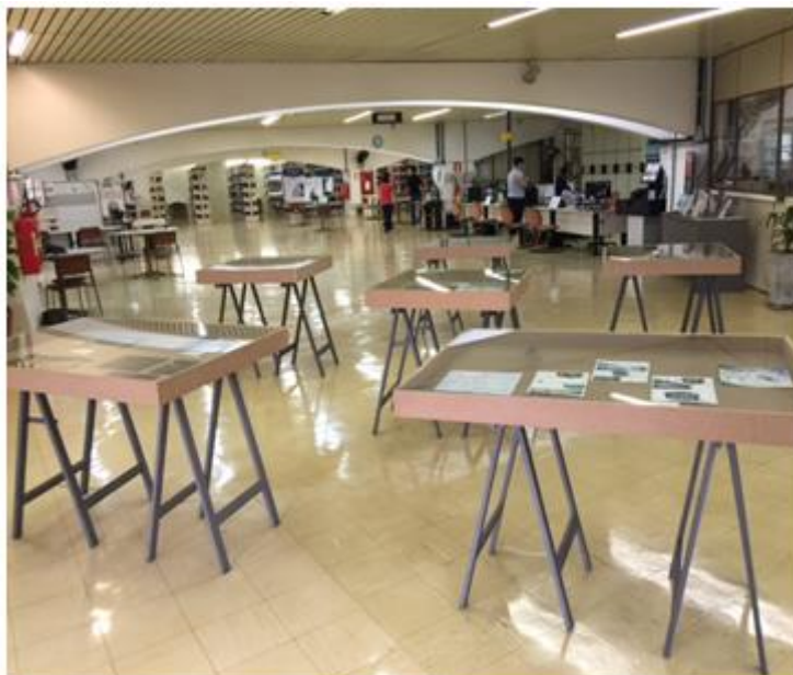
Figura 15: Foto da Exposição Arte & Estágio: Vivências e Percursos Poéticos.