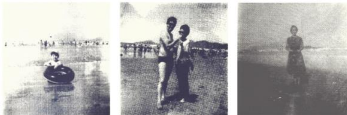
Figura 02: Reprodução de fotos extraídas do trabalho de Amália Barrio Rodrigues.