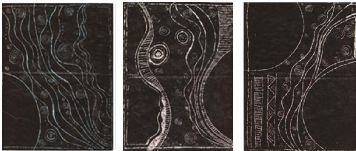
Figura 11: Trabalho de pintura em giz de cera com raspagem de Marion Franzini Chatton.

Nesta proposição, Marion elaborou estes trabalhos (figs. 11, 12 e 13) utilizando materiais próprios dos ambientes escolares: giz de cera e papel sulfite.