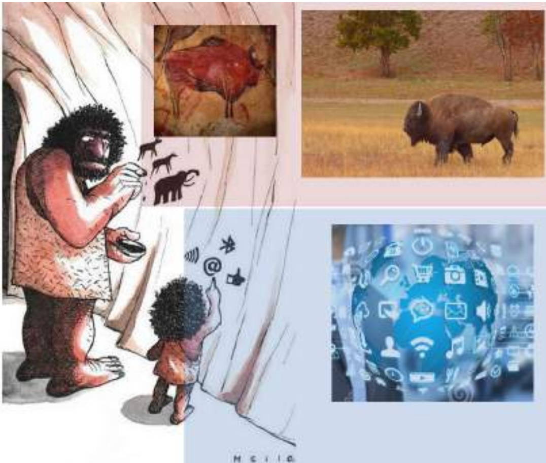
Fig. 6. M.C. Martins. Passado e presente , 2017. Montagem digital a partir do cartoon de Silvano Mello.

elas ou no canto da folha, as crianças veem e leem as imagens e imagens de outras imagens.