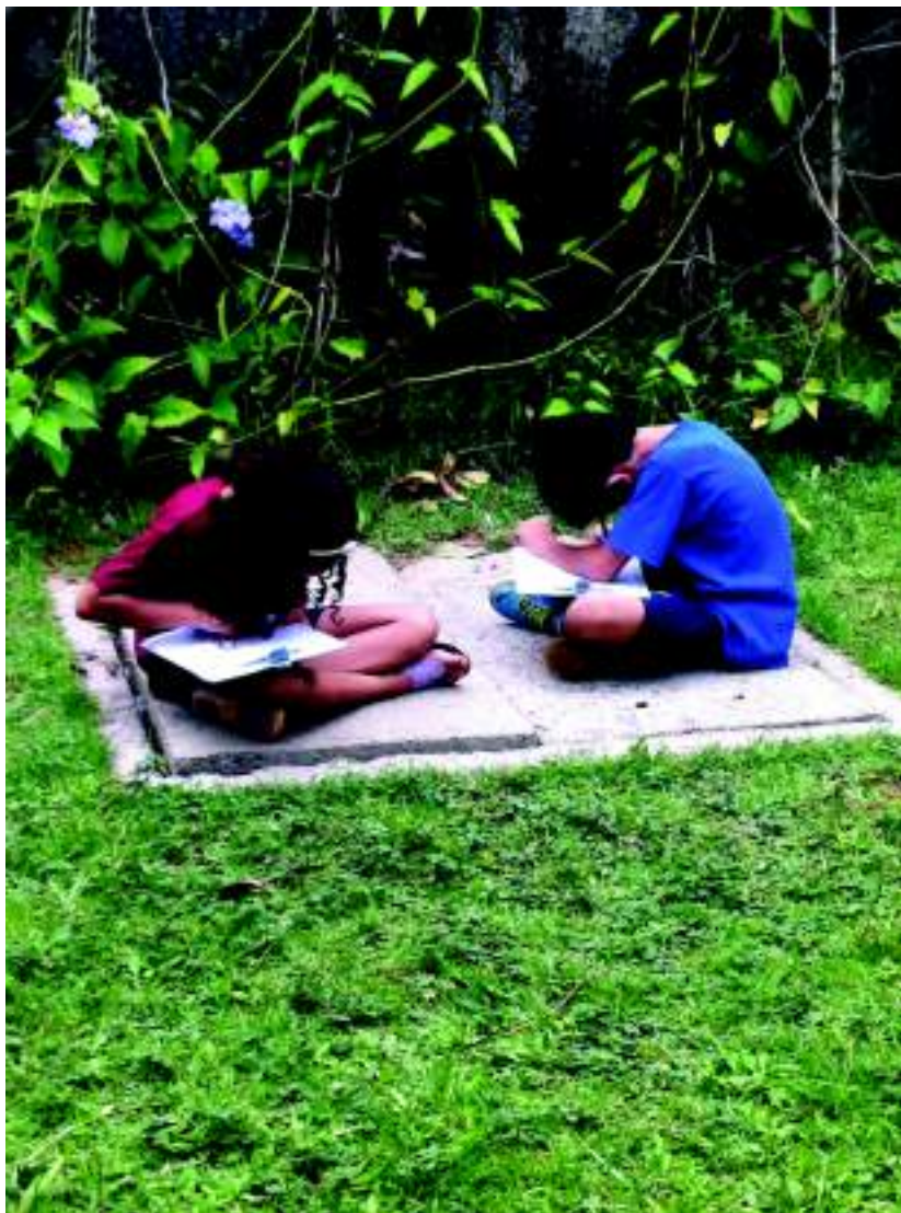
Fig. 1.

Nesse sentido, conceber a aula como uma atitude estética para além da obra de arte, no que chamarei de estética da docência, visaria criar essas fissuras no interior dos discursos dominantes e cristalizados da educação.