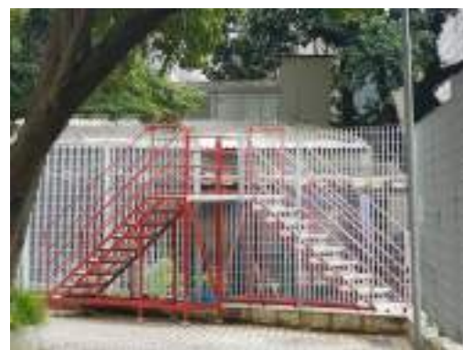
Fig. 3 e 4. Visão geral do site specific Escada-escola , de Carmela Gross, em 2017, compondo a exposição Arte à mão armada no Museu da Cidade – Chácara Lane.

Diz Carmela Gross (2016): “A escada apaga os limites físicos entre os dois espaços, recompondo a atividade artística como ação lúcida e lúdica e pensando a