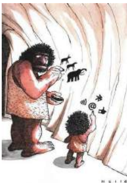
Fig. 5. Silvano Mello. Sinais rupestres , 2013. Cartoon.