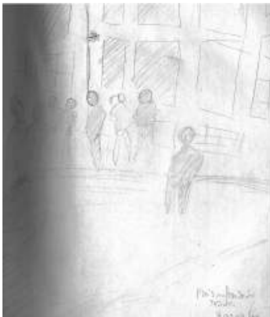
Figura 4: Ilustração a lápis da silhueta de policiais em frente à assembleia às escuras em frente a reitoria.

Fonte: Ilustração feita por Isabelle dos Anjos (2016) e cedida para este trabalho.