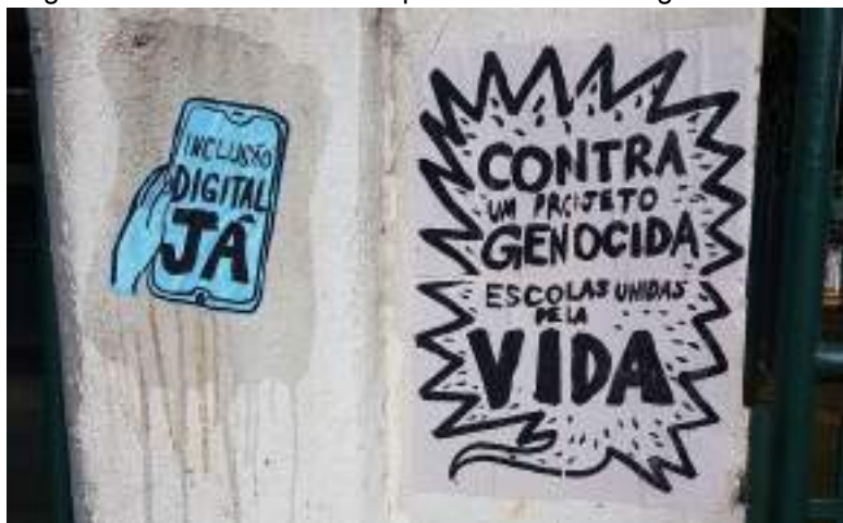
Figura 8: Lambes colados na porta da escola em greve.

Houve êxito na luta pela vacina, comida e inclusão digital da greve pela vida e também na luta pelo pagamento das bolsas atrasadas. Cada residente é agente da própria história, e viver este edital em época pandêmica e de constantes ataques à educação e políticas de permanência foi um desafio que se perpetuará por toda a carreira docente.