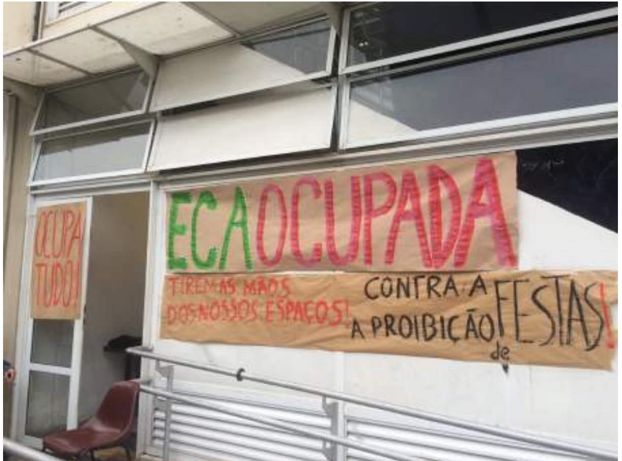
Figura 2: Faixa na entrada da Ocupação da ECA.