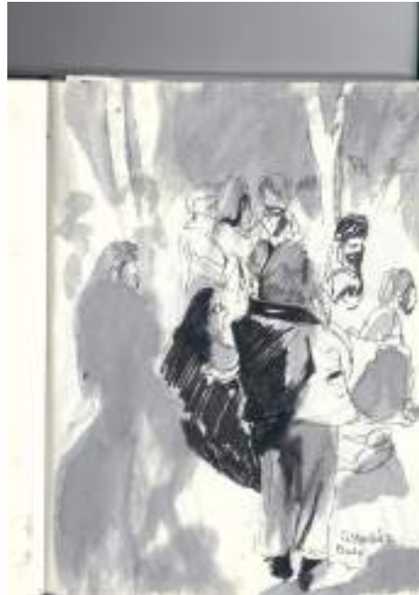
Figura 1: Ilustração a nanquim de assembleia no CRUSP.

Fonte: Ilustração feita por Isabelle dos Anjos (2016) e cedida para este trabalho.