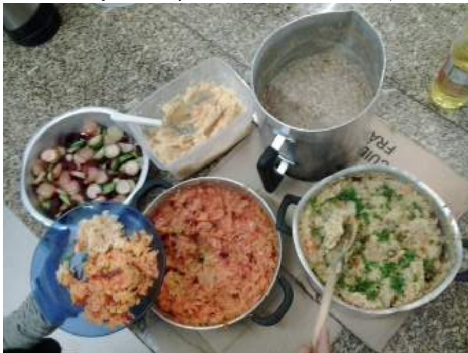
Figura 3: Almoço coletivo feito na cozinha da OcupaECA.