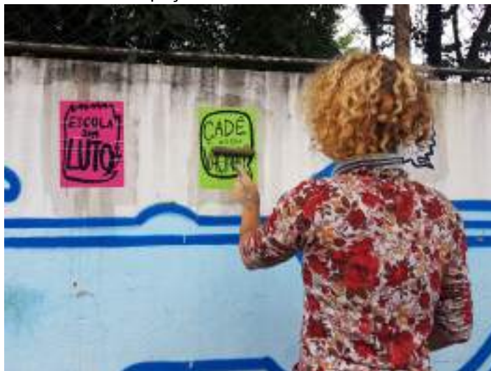
Figura 5: Professora da EMEF Espaço de Bitita colando lambes no muro da escola.

problema estrutural da forma de produção da megalópole de São Paulo. A vontade de ouvir o aluno para acolher as dúvidas e construir educação era atropelada pela falta de WI-FI, 3G, aparelhos eletrônicos. A presença que se preza na aula normalmente não encontrava qualidade quando não havia cartão de merenda, cesta básica garantida, auxílio emergencial que fechasse as contas, colocando alunos frente às preocupações da vida adulta que roubavam a infância com ansiedades que reverberaram na relação com os estudos. Mesmo assim, a equipe não foi fatalista, disputou com toda disposição o melhor para a comunidade escolar.